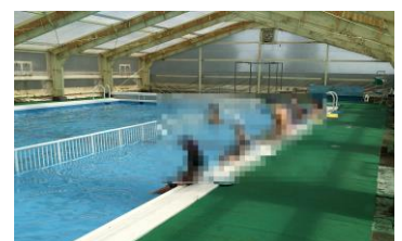
写真にはモザイク処理しております。

昨年度は実施出来なかった水泳学習。今年度は、すでに市内の小学校で実施されていますが、本校は自校プールということもあり、設営準備や水温の確認を経て、今回の開始となりました。水泳学習は、自分に適した泳法を理解する(泳ぎ方の習得)ことと生涯スポーツの水泳について理解する(水中安全教育や水泳の事故防止)ことをねらいとして実施しております。早速、子どもたちは楽しそうに活動していました。