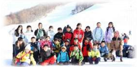
2年生 [ ] さん