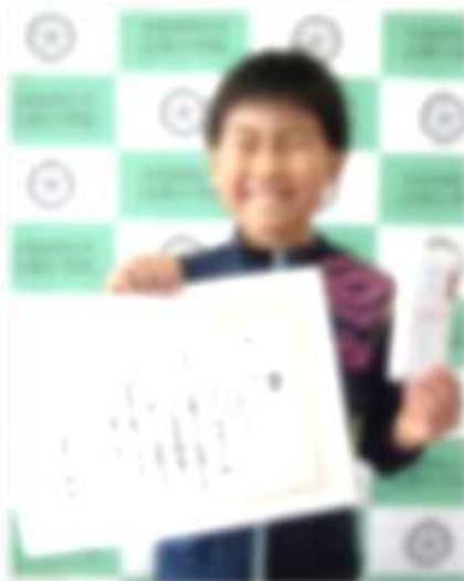
第35回 とかち・ひだか児童 版画コンクール 銅賞 3年生 [ ] さん