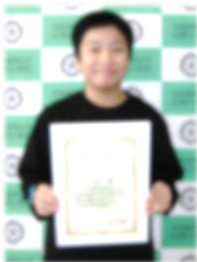
第24回 音更町町民大会 町民冬季 ソフトテニス大会 竹組 準優勝 5年生 [ ] さん