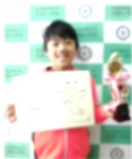
第34回 しげ吉杯 全十勝小学生 バレーボール大会 混合の部 準優勝 3年生 [ ] さん